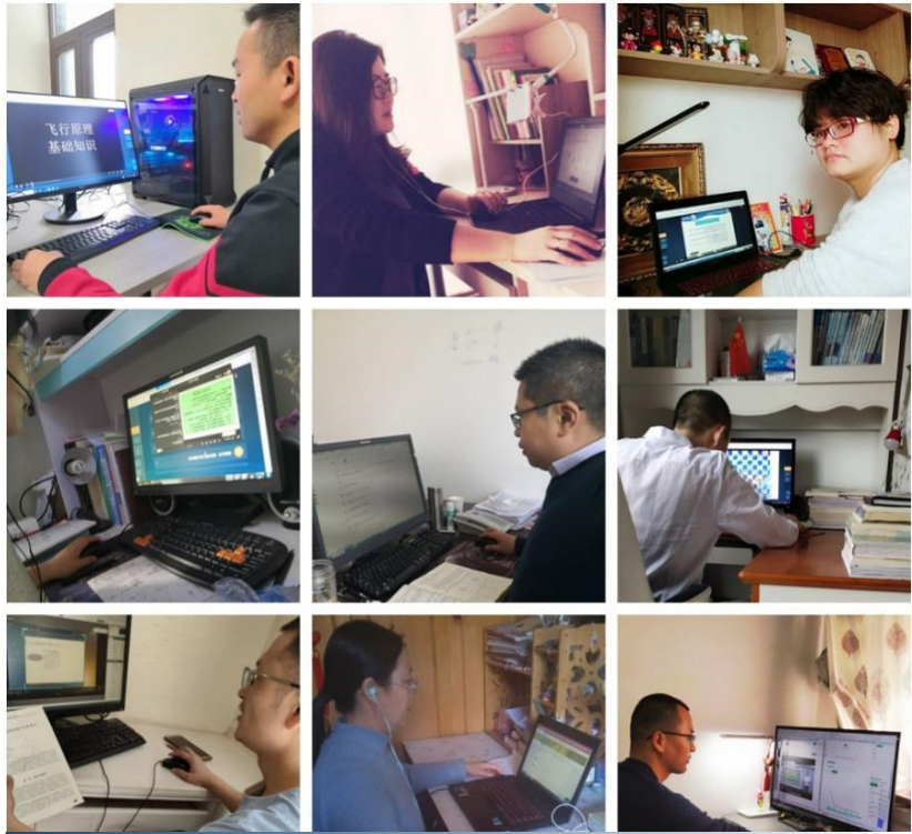
▲ 测绘学院教师开展在线教学

是我校专业建设水平最高的学院之一。在长期的教育教学中,积累大量优秀的教学资源,所培养的技术技能型人才受到行业企业的普遍好评,在网络教学领域内有着较强的探索精神和实践能力。