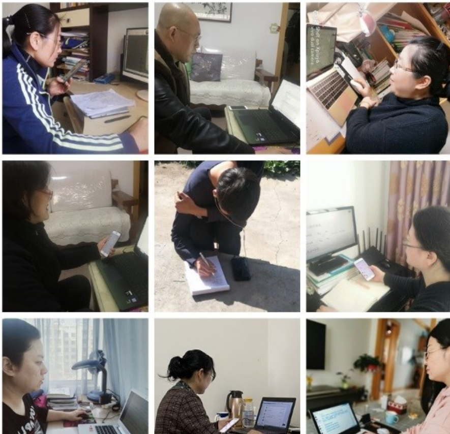
▲ 公共课教学部教师开展在线教学

全校教职工人数最多的教学部门之一,也是开展在线教学最早的教学部门之一。在疫情防控延期开学期间,他们积极地利用云班课、云教材开展线上教学。