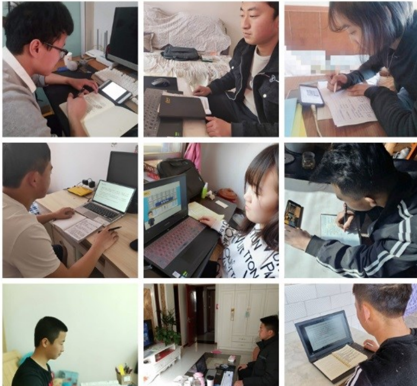
▲ 建筑学院学生在线自主学习

的普遍欢迎。学生们大多都来自农村，他们不畏困难、认真踏实的学习态度折射出我校良好学教育教学效果。