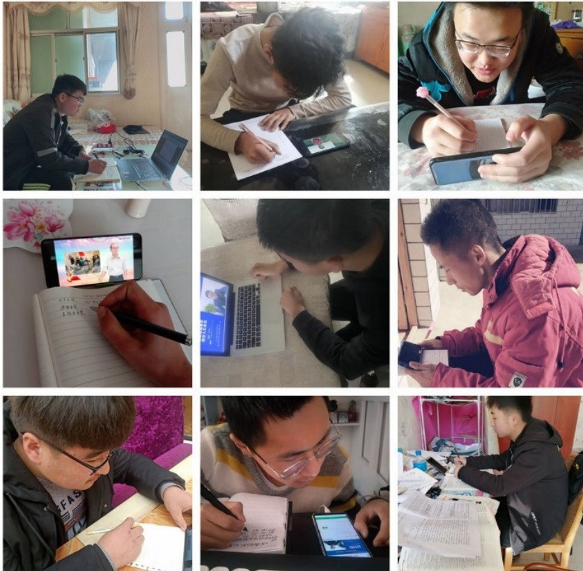
▲ 地质学院学生在线自主学习