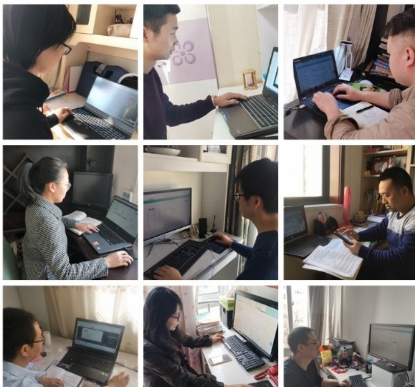
▲ 建筑学院部教师开展在线教学

是我校专业设置数量最多的教学部门之一，教师信息化教学水平普遍较高，在疫情防控延期开学期间，他们利用自身技术优势，成为学校中青年教师在线教学的主力军之一。