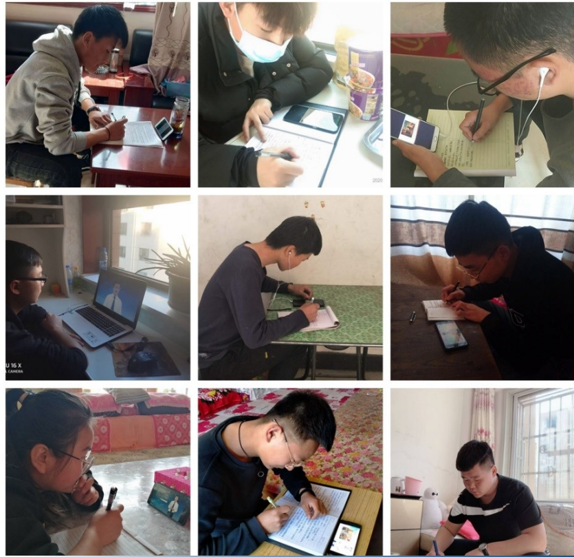
测绘学院学生在线自主学习 ▲

学校现有全日制在校生7806人(不含扩招)。在疫情防控延期开学期间，他们在家通过手机、笔记本、平板、电视等网络渠道开展自主学习，新的学习方式给学生带来了全新的学习体验，受到同学们